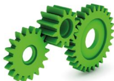
moulin à eau