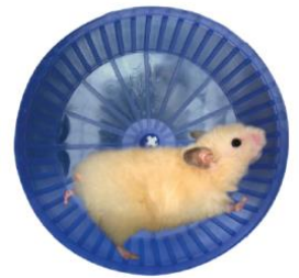
roue de hamster