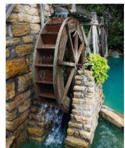
moulin à eau