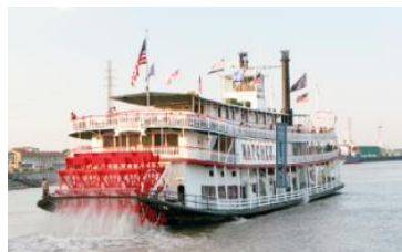
bateau à aube